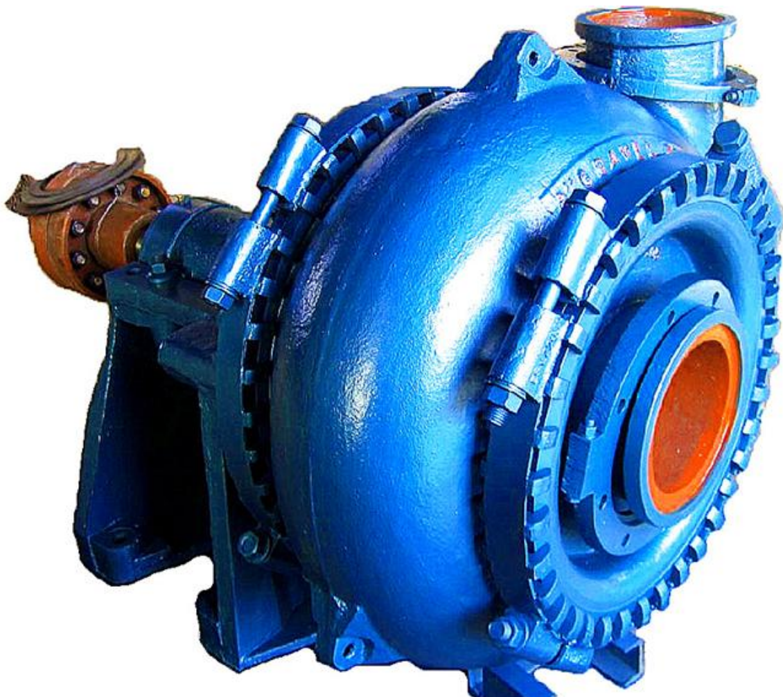
Фото #1: Насос для добычи песка и гравия DRW Pump 8/6E-G

Предлагаем Вашему вниманию горизонтальный, одноступенчатый, центробежный насос для добычи песка и гравия DRW Pump 8/6E-G (Warman Technology), производства компании "Земснаряды Украины". Насос оснащен широким осевым входом для прокачки смеси с содержанием частиц большого размера и изготовлен из стали с твердостью HRC 58-64 повышенной износостойкости, что позволяет существенно увеличить срок службы.