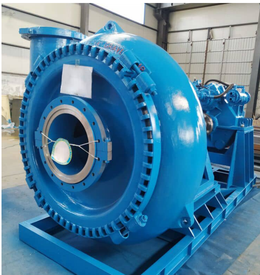
Фото #1: Насос для добычи песка и гравия DRW Pump 18/16T-G

Предлагаем Вашему вниманию горизонтальный, одноступенчатый, центробежный насос для добычи песка и гравия DRW Pump 18/16T-G (Warman Technology), производства компании "Земснаряды Украины". Насос оснащен широким осевым входом для прокачки смеси с содержанием частиц большого размера и изготовлен из стали с твердостью HRC 58-64 повышенной износостойкости, что позволяет существенно увеличить срок службы.