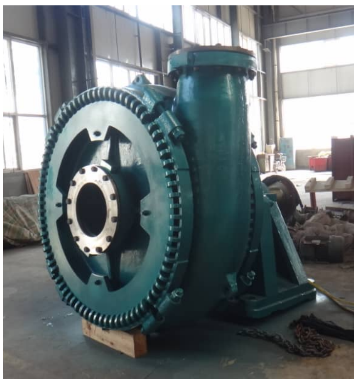
Фото #1-2: Насос для добычи песка и гравия DRW Pump 16/14TU-GH