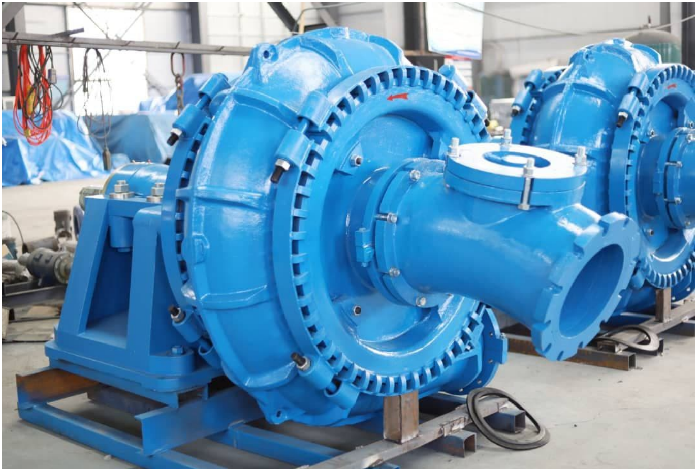
Фото #1: Насос для добычи песка и гравия DRW Pump 14/12G-G

Предлагаем Вашему вниманию горизонтальный, одноступенчатый, центробежный насос для добычи песка и гравия DRW Pump 14/12G-G (Warman Technology), производства компании "Земснаряды Украины". Насос оснащен широким осевым входом для прокачки смеси с содержанием частиц большого размера и изготовлен из стали с твердостью HRC 58-64 повышенной износостойкости, что позволяет существенно увеличить срок службы.