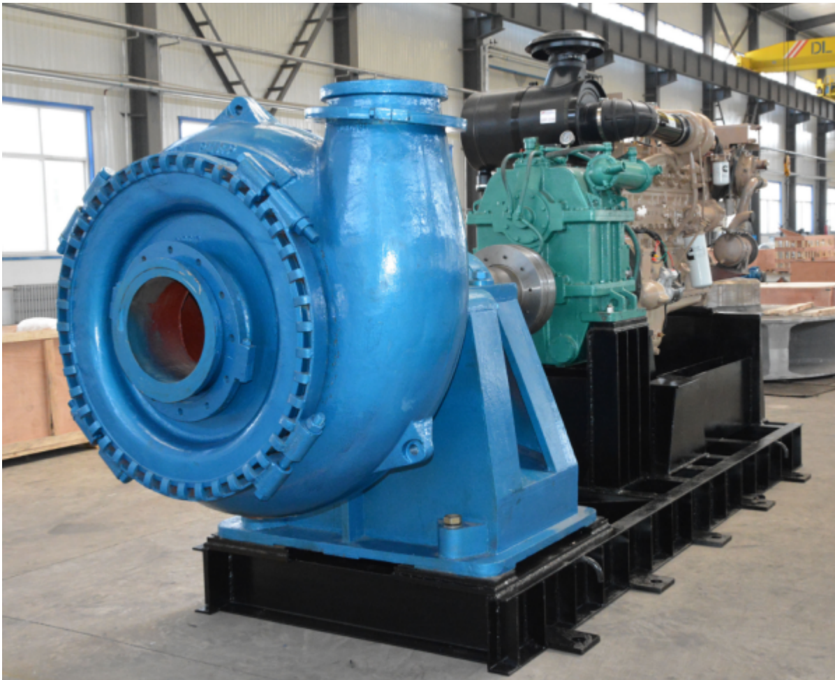
Фото #1: Насос для добычи песка и гравия DRW Pump 12/10G-GH

Предлагаем Вашему вниманию горизонтальный, одноступенчатый, центробежный насос для добычи песка и гравия DRW Pump 12/10G-GH (Warman Technology), производства компании "Земснаряды Украины". Насос оснащен широким осевым входом для прокачки смеси с содержанием частиц большого размера и изготовлен из стали с твердостью HRC 58-64 повышенной износостойкости, что позволяет существенно увеличить срок службы.