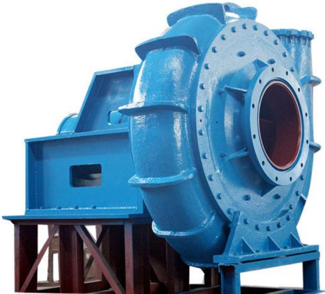
Фото #1: Насос для добычи песка и гравия DRW Pump 10/8S-GH

Предлагаем Вашему вниманию горизонтальный, одноступенчатый, центробежный насос для добычи песка и гравия DRW Pump 10/8S-G (Warman Technology), производства компании "Земснаряды Украины". Насос оснащен широким осевым входом для прокачки смеси с содержанием частиц большого размера и изготовлен из стали с твердостью HRC 58-64 повышенной износостойкости, что позволяет существенно увеличить срок службы.